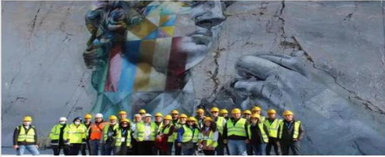
Doğal taş madencileri iş sağlığı ve güvenliği önlemlerini İtalya'da inceledi

DHA 22.11.2021 - 12:51 | Son Güncelleme : 22.11.2021 - 13:23